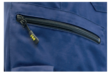
Deux poches cuisse

Ceinture souple pour une aptation optimale de la forme