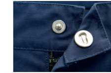
Bouton COBRAX TRA-IN

Bouton COBRAX TRA-IN pour une fermeture sûre à la ceinture